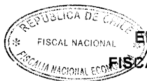
ENRIQUE VERGARA VIAL FISCAL NACIONAL ECONÓMICO