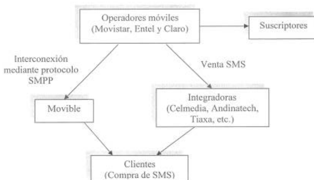
Figura N° 1 Esquema mercado mensajería corta de texto masiva