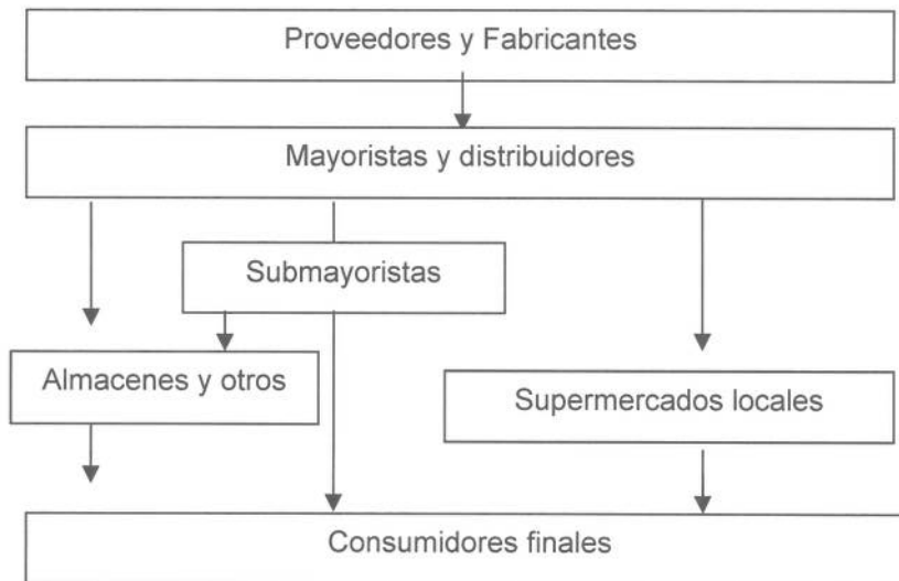
Figura N° 1 Actores del canal mayorista