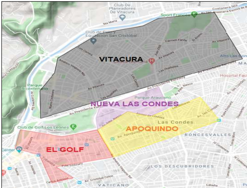
Mapa 1. Segmentación de barrios en Las Condes y Vitacura.